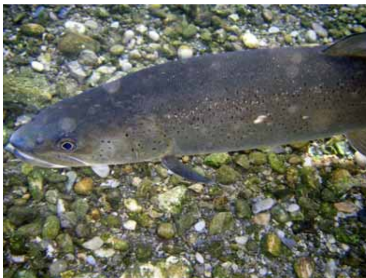
Slika 1 Sulec (Hucho hucho) vložen v vodo posebnega pomena.

Skladno z RGN ZZRS je bila čuvajska služba organizirana tako kot prejšnja leta. Izvajali so jo štirje redno zaposleni ribiški čuvaji in tudi ribiški čuvaji prostovoljci.