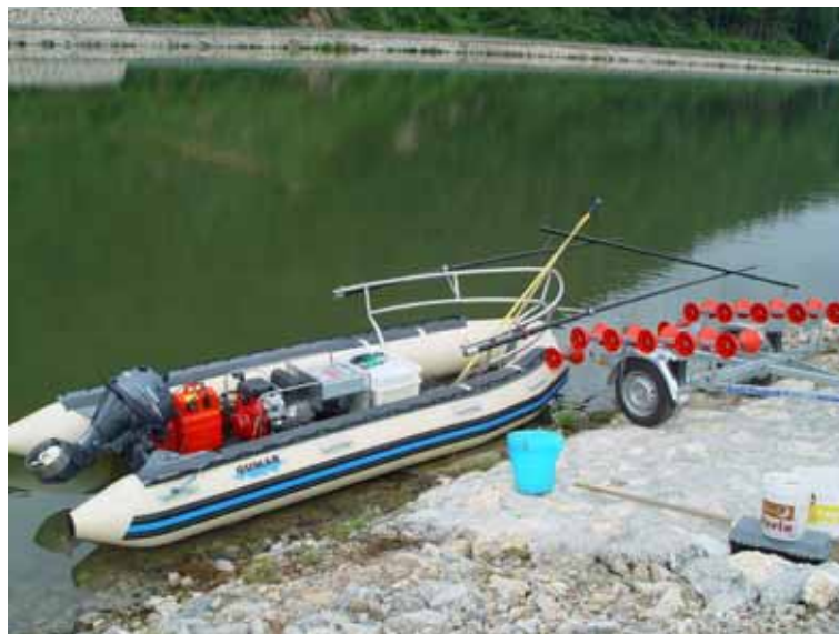
Slika 7 Čoln Zavoda za ribištvo slovenije za elektro izlov rib v večjih vodotokih.

Naročnik je Inštitut za vode RS. Projekt se nadaljuje.