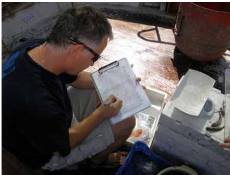
Slika 2 Terensko delo v okviru naloge Monitoring ribolovnih virov s pridneno vlečno mrežo.