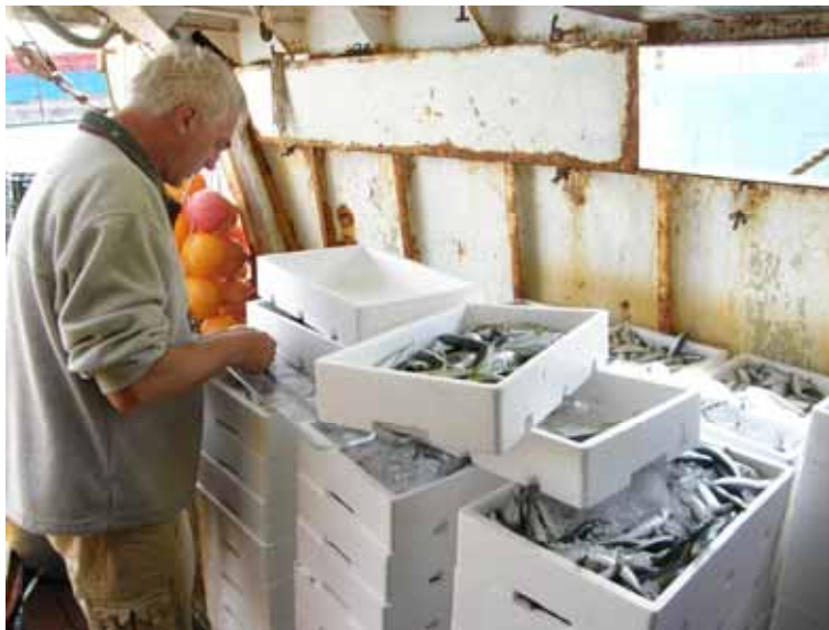
Slika 5 Merjenje rib v oviru naloge Ocena prilova in zavržka je biološko vzorčenje.