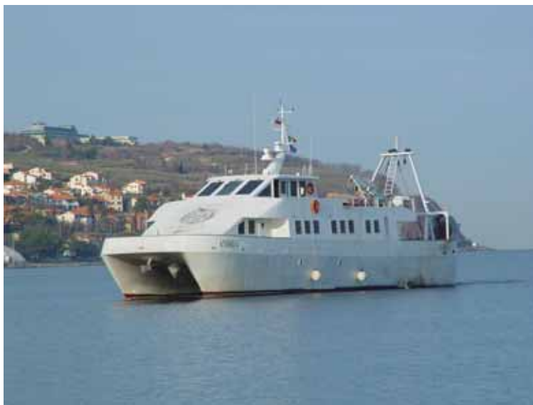
Slika 3 Raziskovalna ladja Andrea s katero vzorčimo po programu raziskovanja z vlečno mrežo v Sredozemlju.