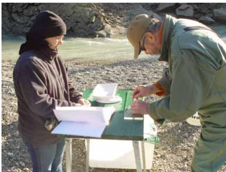
Slika 6 Meritve rib na ihtioloških raziskavah.

SRS je v okviru raziskovalne dejavnosti ustvarila velik del svojih prihodkov tudi na trgu. Nekaj raziskovalnih projektov smo končali, nekaj pa se jih še nadaljuje. Opravljeno delo je opisano v nadaljevanju.